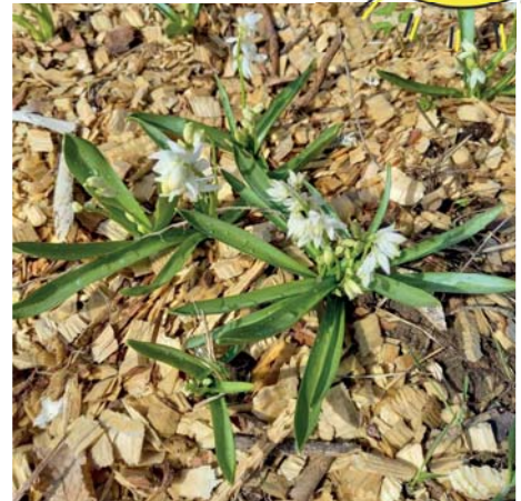
Syksyllä monikselle istutetut 1000 kukkasipulia kukkivat pian täydessä loistossaan.

Tiistaina klo 18 alkaen monitoimitalolla tarjoillaan talkoolaisille grillimakkaraa kiitokseksi siististä kylästä. Saunakin lämpimää, jos saunoja ilmoittautuu: naisille klo 18 ja miehille klo 19.30.