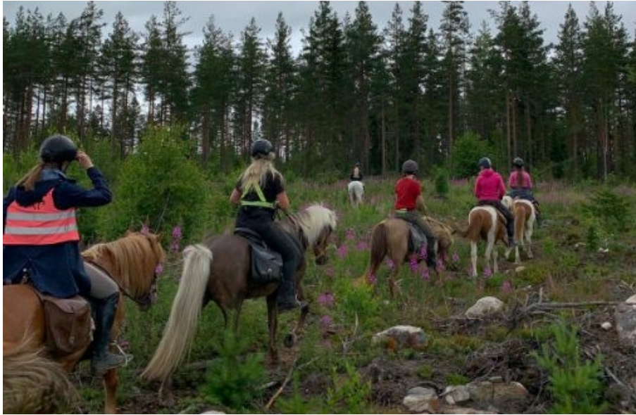
Kotitalli Hersirin Islannin hevosilla, issikoilla, tehdään vaellusratsastuksia lähitieneon maastoissa.

Tiedote kyläläisille Selin tapahtumista 2/2020