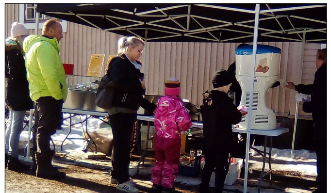
Seppolan tapahtumissa saadaan nauttia myös hyvistä ruokatarjoiluista.

Teksti Matti Heikkilä